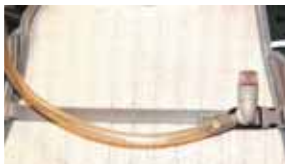
SMART: Sterk magnet til drikkeslange på Osprey Raptor