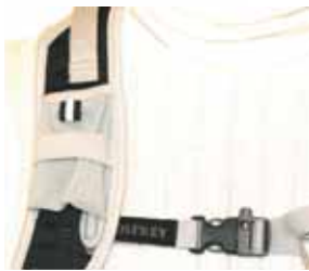
SMART: Floyte på brystsenne og lommer på skulderstropper på Osprey Talon