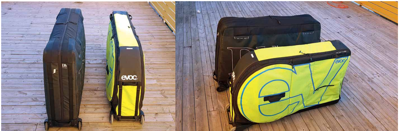
Evoc og Douchebag er årets duellanter i sykkelbag testen. Evoc og Douchebag er forholdsvis like i størrelsen.